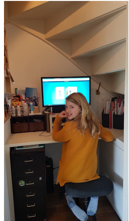
Online opdrachten maken.