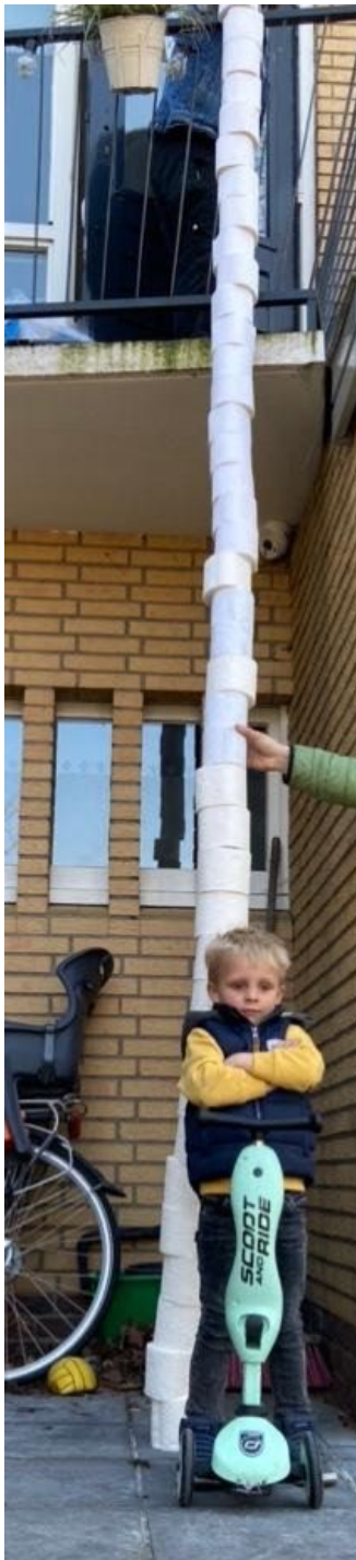
Wie bouwt de hoogste toren van WC-rollen?

De kinderen zijn thuis goed bezig met hun schoolopdrachten. We krijgen mooie foto's binnen! Hieronder een impressie: