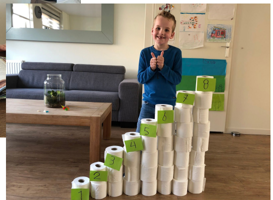
Maak een trap van wc-rollen; steeds 1 erbij.