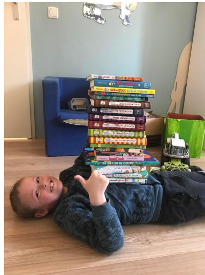
Leg je boeken op alfabet.