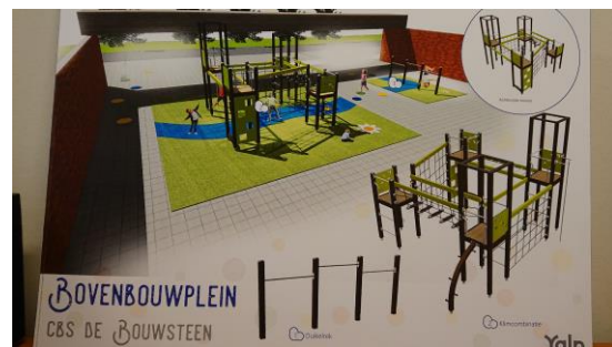
Ingediend voorstel bovenbouwplein